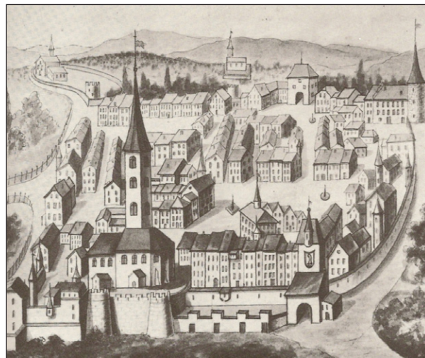
Ville de Delémont au XVII e siècle.

Plus qu'un dictionnaire, le DIJU doit ainsi être considéré comme une véritable base de données interactive, une référence encyclopédique pour la région jurassienne. Il présente trois types de notices : des notices biographiques (personnalités politiques, artistes, religieux-ses, sportif-ves, industriels, etc.), thématiques (groupements politiques, autorités, institutions, événements, histoire, entreprises, industries, etc.) et géographiques (communes, sites archéologiques, lieux de culte, etc.).