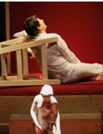
Pygmalion amoureux d'une nymphe. LDD

Dans «Pygmalion», Jean-Jacques Rousseau s'inspire du célèbre mythe transmis par «les Métamorphoses» d'Ovide, celui du sculpteur Pygmalion qui tombe amoureux de la statue de la nymphe Galatée qu'il vient de créer lui-même, suppliant Vénus de lui donner vie. Cette pièce, présentée à la Comédie française en 1775, est aussi à l'origine d'un genre nouveau: le mélodrame. La musique de l'époque ayant pris quelques rides, la compagnie de l'Organon s'est adressée au compositeur Richard Dubugnon pour réactualiser ce mélodrame en lui offrant une nouvelle composition. Quant à la partie consacrée à